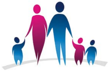
KARTA JAWORZNICKIEJ RODZINY WIELODZIELNEJ

Dzięki zmianie uchwały w sprawie wyboru metody ustalenia opłaty za gospodarowanie odpadami komunalnymi rodziny, które mają na utrzymaniu troje lub większą liczbę dzieci i przy-