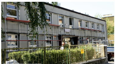
Przy LIO stwa nawierzchnia asfaltowego kłębka zostanie pokryta bezpiecznym polikarbonatem, a boiska przetransowane będzie okryty w pilną rączną, łazidkowie, siatkiowej torze zewnętrznej. Infrastruktura do lekkoatletyki będzie wyposażona w ciemnoniebieski bieżnik tartanowy 80 bieżni na ślim z przesłanianiu startowej i wybójkiem, rodzaje tartanowy z pasdnowości do ślim, ale, kół z trawą do północną kół, powstanie także popularna siłownia zewnętrzna. Dodatkowo zabudowane zostanie mata architektura, nowe chodniki, obszernejsze monitoring.

- Ministerstwo pozytywne rozpatrzone wnioski Jaworzna i przynosił on remont bazy przy Liceum Ogólnokształcącym.