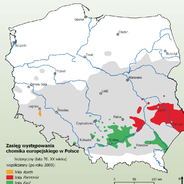
Zasięg występowania chomika europejskiego w Polsce — historyczny (lata 70. XX wieku) — współczesny (po roku 2000): — linia North — linia Pannonia — linia East

Chomik europejski żyje przede wszystkim na polach ornych, na których uprawia się zboża, rośliny korzeniowe lub lucernę, ale również na łąkach, nieużytkach, miedzach, w ogródkach, sadach, plantacjach i terenach zabudowanych. Występuje od Francji (Alzacji) w Europie Zachodniej po Jenisej w Azji. W Polsce jego stanowiska spotyka się w pasie wyżyn od Dolnego Śląska po Zamojszczyznę. W naszym kraju wyróżnia się trzy linie filogeograficzne chomików, o różnych historiach pochodzenia.