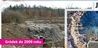
Grodok do 2009 roku