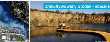
Zrekultywowany Groddek - obecnie