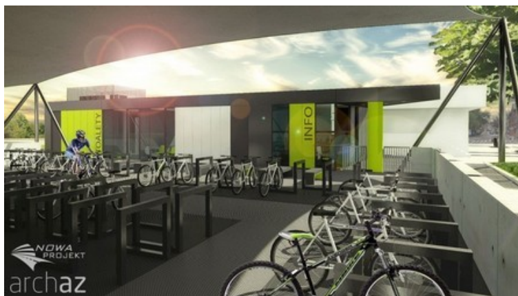
Wizualizacja Miejskiego Centrum Integracji Transportu

Po przebudowie Placu Górników zostanie wdrożony system wypożyczalni rowerowych w Jaworznie. Planuje się uruchomienie systemu w formie wynajmu kompletnego systemu.