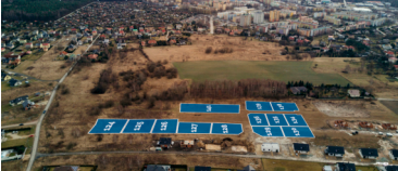
Działki w okolicy ul. Storczyków 5/Syrokolki

Storczyków / Syrokolki – Dąbnowa Narodowa (18 działek) W środę, 3 czerwca, nabywcy będą mogli liczyć na 18 działek położonych w Dąbnowej Narodowej w okolicy ul. Storczyków / Syrokolki. Powierzchnie dostępnych nieruchomości wahać się będą 658 m 2 a 959 m 2 i są opatrzone dla budowy domu jedynostanowego z przedmiotowym ogrodem. W ofercie znajduje się też jedna działka o zabudowie wieloletniej – 1.030 m 2 .